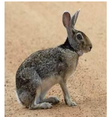
Lièvre à collier noir ( Lepus nigricolis )

A l'occasion de la Saint Hubert, saint patron des chasseurs, célébré le 3 novembre, la Fédération organisera « La Fête de la Chasse et de la Nature » le samedi 08 et dimanche 09 novembre 2014 à Saint-Pierre au lieu-dit « la Ravine Blanche ». Nous sortirons une édition spéciale courant octobre pour vous communiquer de plus amples informations.