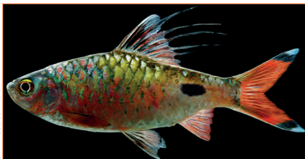
Dawkinsia spp. ; Dawkinsia filamentosa – Barbu à tache noire