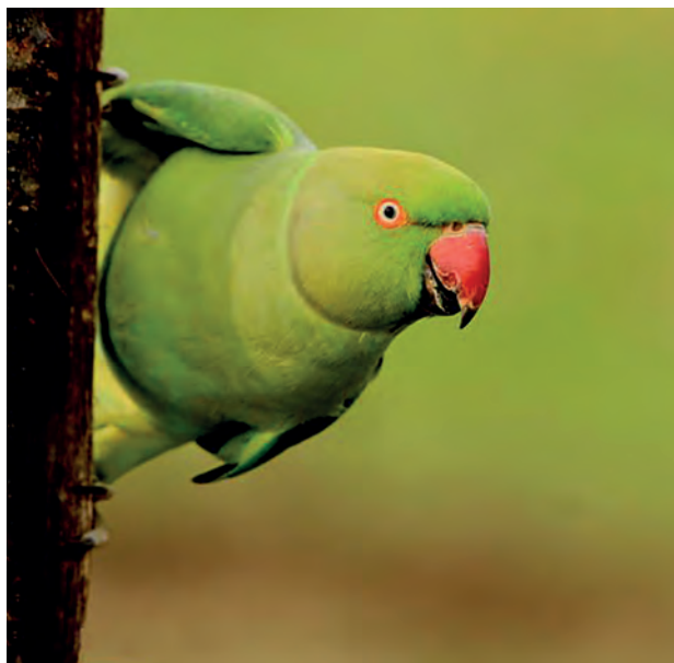
Perruche à collier

Pour accompagner ce réseau d'acteurs, le Groupe Espèces Invasives de La Réunion a été mis en place : https://www.especesinvasives.re