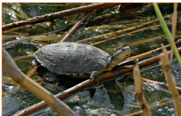
Chelonii (tortues aquatiques) ; Pelomedusa subrufa