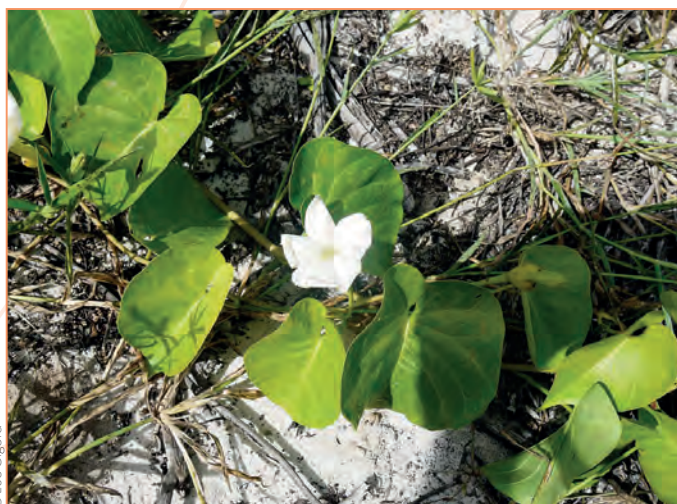
Houttuynia cordata – Plante caméléon