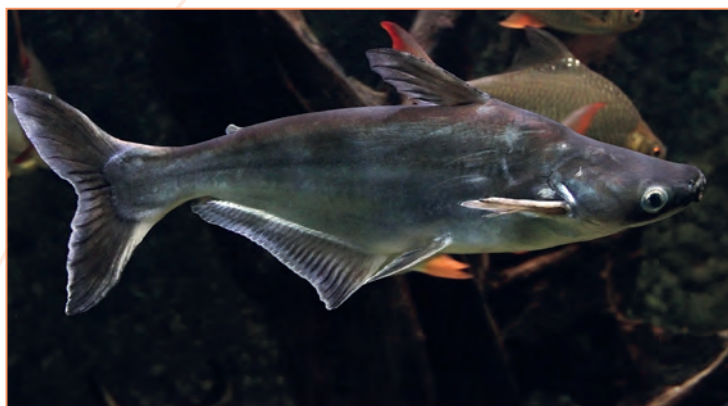
Pangasiidae ; Pangasianodon hypophthalmus – Panga