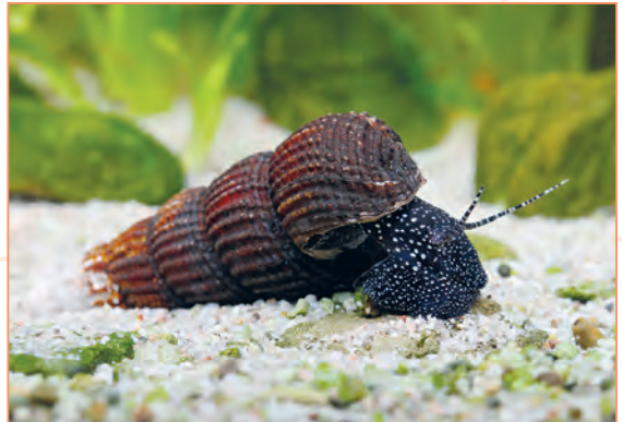
Gastropoda ; Tylomelania patriarchalis – Escargot éléphant