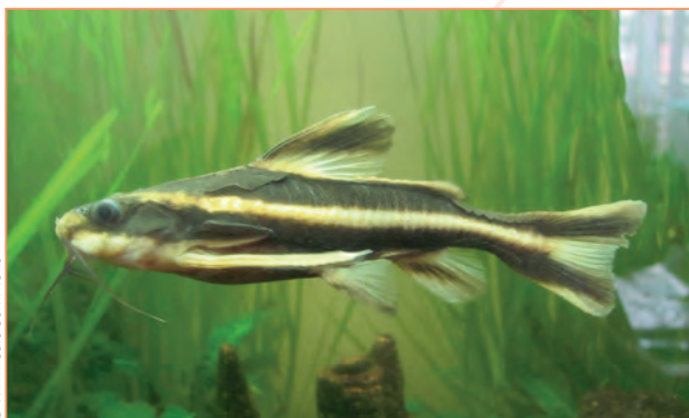
Doradidae ; Platydoras costatus – Silure rayé