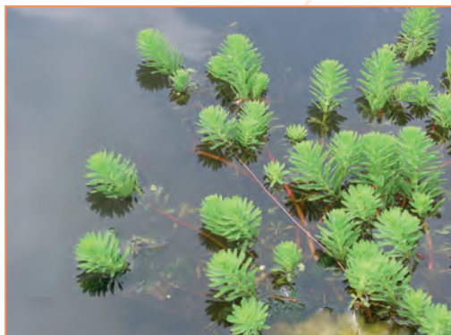
Cabomba caroliniana – Cabomba ou éventail de Caroline