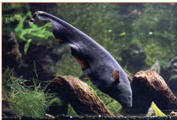
Gymnotyformes ; Apteronotus albifrons – Poisson-couteau