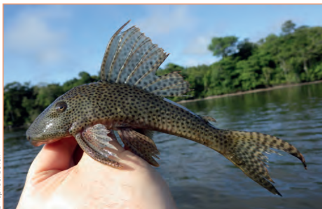
Locariidae ; Hypostomus gymnorhynchus – Pléco