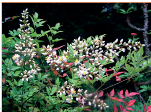
Ilex aquifolium – Houx