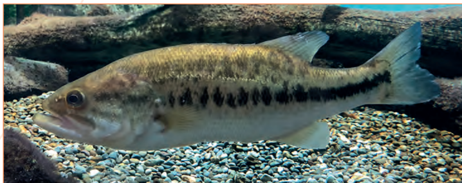
Centrarchidae ; Micropterus salmoides – Achigan à grande bouche, Black-bass, perche d'Amérique, perche noire, perche truitee