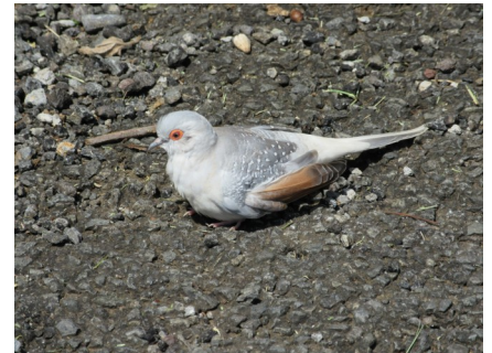
Tourterelle pays ( Geopelia striata )