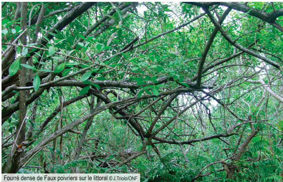
Fourré dense de Faux poivriers sur le littoral

Arbuste ( sur le littoral ) ou arbre ( en forêt ) présent sur tout le pourtour de l'île jusqu'à 1000 mètres d'altitude environ, à l'exception des zones très sèches. Forme de larges fourrés monospécifiques difficilement pénétrables en particulier sur le littoral ou dans les zones perturbées de forêt de basse altitude. L'espèce est disséminée efficacement par les oiseaux, en particulier le Merle de Maurice.