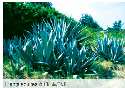
Plants adultes