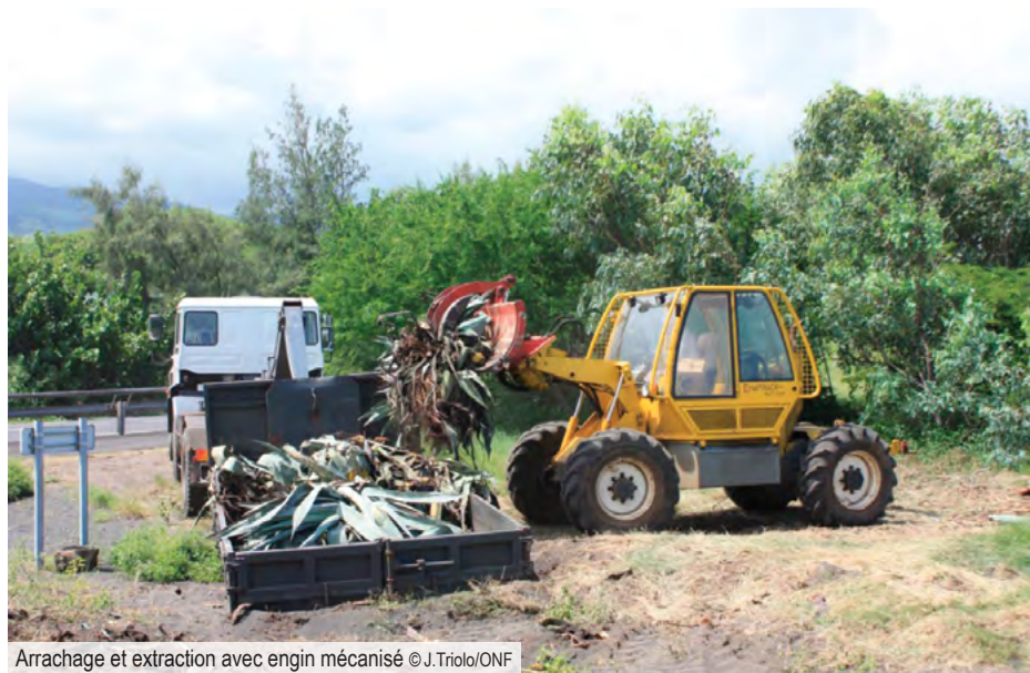
Arrachage et extraction avec engin mécanisé

Le Choca bleu est une Agave géante qui possède de longues feuilles aux reflets bleutés, ainsi que de nombreuses épines rouges sombres sur la marge. Elle est envahissante principalement sur la zone littorale sèche à La Réunion. Elle possède une bonne résistance aux embruns. Sa hampe florale forme un mât de près de 5 m de hauteur et produit des fruits et bulbilles au sommet.