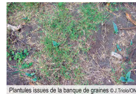
Plantules issues de la banque de graines